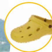
Artikel 8900040 Farbe: gelb