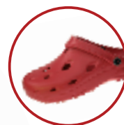
Artikel 8900030 Farbe: rot