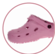
Artikel 8900070 Farbe: rosa