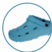
Artikel 8900050 Farbe: hellblau