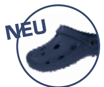
Artikel 8900100 Farbe: navy