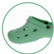
Artikel 8900060 Farbe: hellgrün