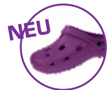
Artikel 8900110 Farbe: violett / brombeere