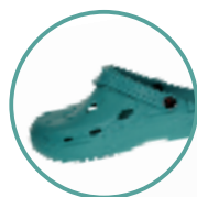
Artikel 8900080 Farbe: aquamarin