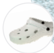
Artikel 8900020 Farbe: weiss