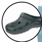
Artikel 8900010 Farbe: schwarz