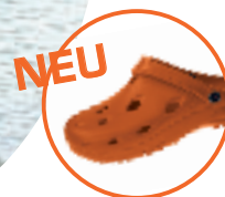
Artikel 8900090 Farbe: orange