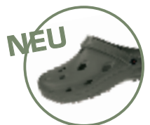
Artikel 8900120 Farbe: khaki